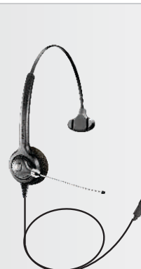
Versión con QD