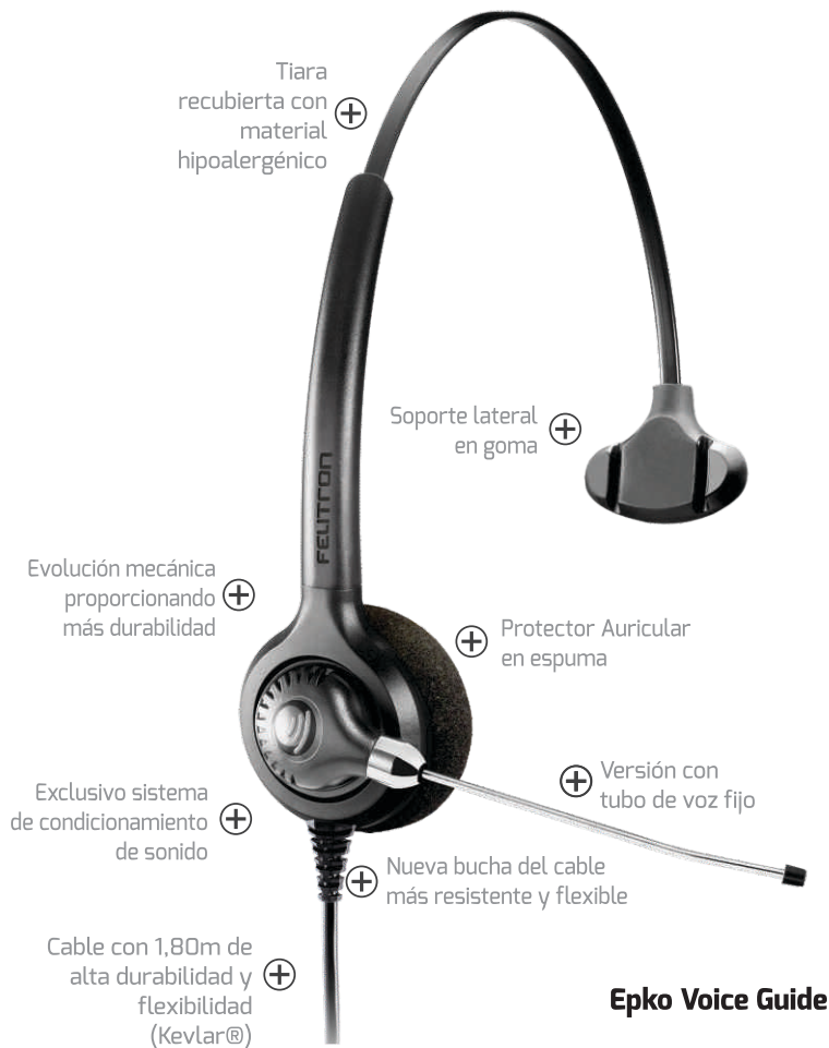
Epko Voice Guide