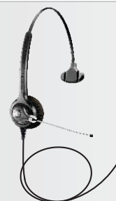
Versión sin QD